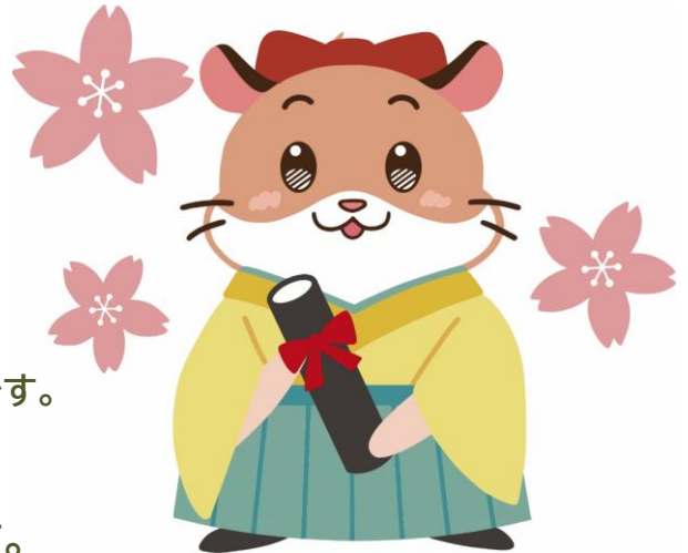
財団公式キャラクター：ヘルム

一人でも多くの後輩に援助ができるように、 どうか寄付のご協力を心よりお願い申し上げます。